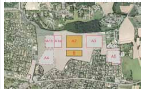
Pièces urbaines : réalisation par étapes