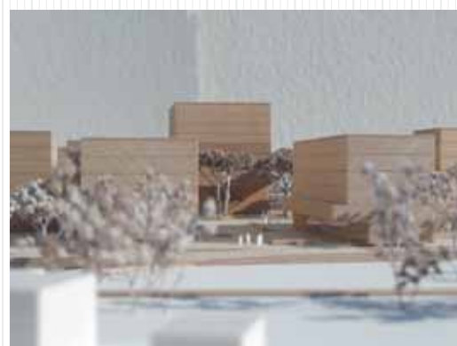
Des vues ouvertes à travers les pièces urbaines