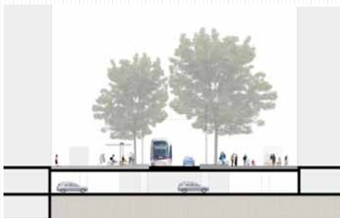
Coupe sur le mail central avec parking en sous-sol