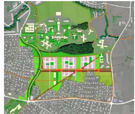
Plan directeur de quartier, 2008