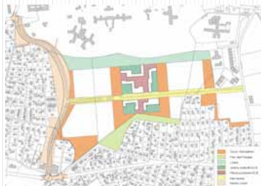
Emprises du premier plan localisé de quartier