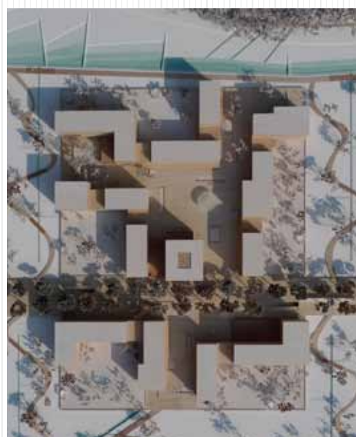
Pièces urbaines, photo de la maquette